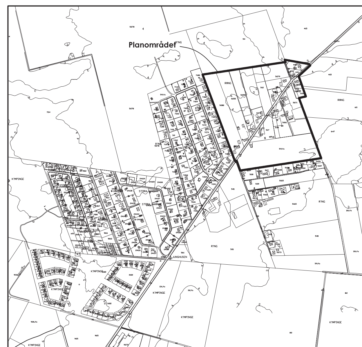
ORIENTERINGSKARTA Rängs Sand Skala 1:8000